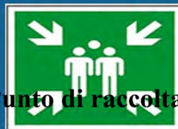
Punto di raccolta

Cartelli di salvataggio: colore di sicurezza VERDE